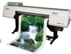
Acuity LED 1600