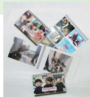
株式会社サイランで制作しているフォトアルバム、カレンダーなどのサンプル。

「このとき、《Form Magic》が A3 サイズという大きな写真の差し替えに対応できたのが説得の大きな材料になったと思いま